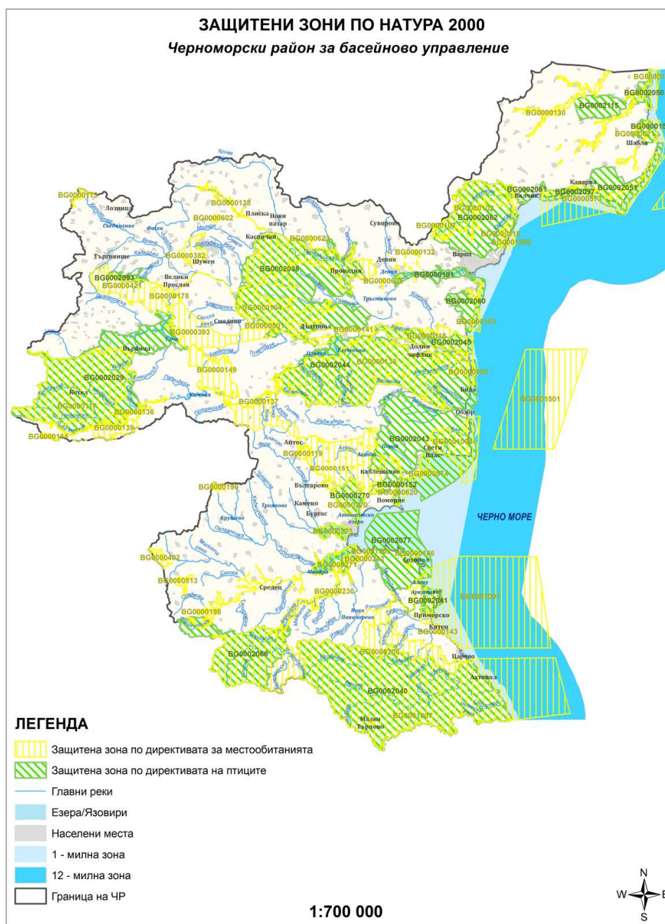
Фигура 4-1 Карта на ЧРБУ и защитените зони по НЕМ Натура 2000 в него

На територията на Черноморски РБУ попадат защитени зони от Натура 2000 по Директива 92/43/ЕЕС за опазване на местообитанията (Директива за местообитания) и по Директива 2009/147/ЕО за опазване на дивите птици (Директивата за птиците). Карта на ЧРБУ и НЕМ Натура 2000 е дадена на Фигура 4-1 и в Приложение 4.