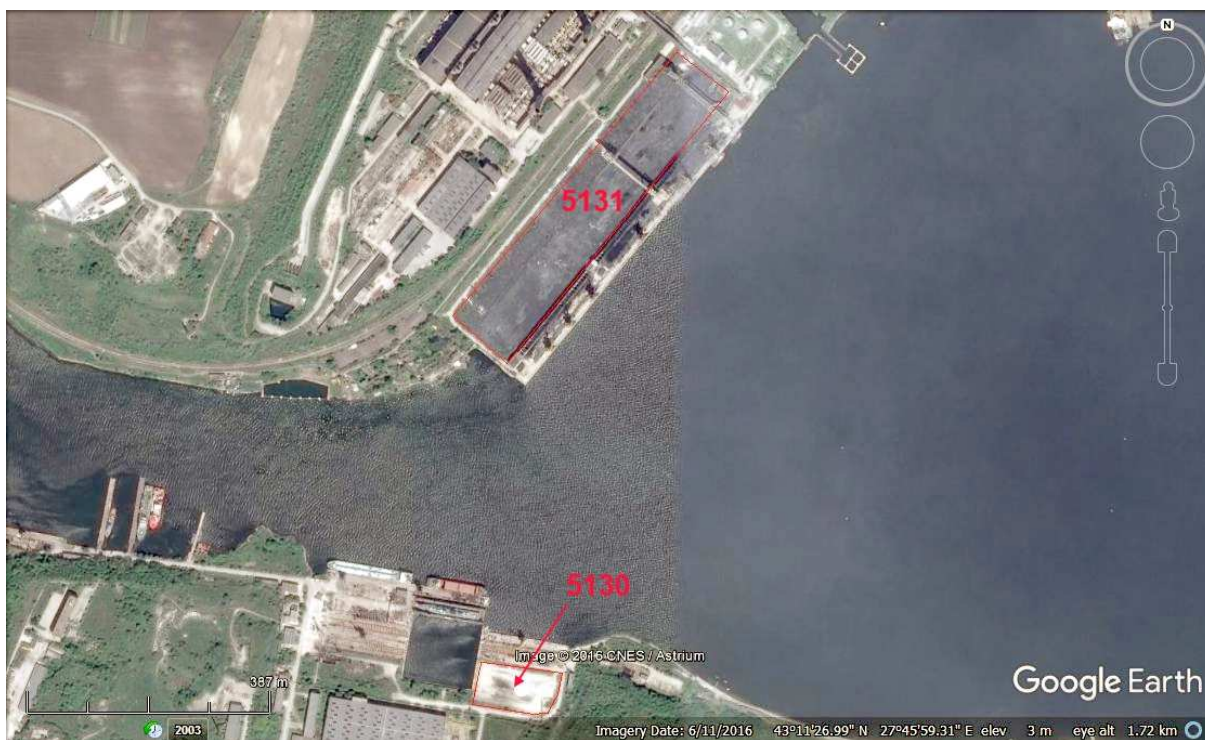
Фигура 5.4.8-1 Характер на терена в и около обхвата на предложените структурни мерки.