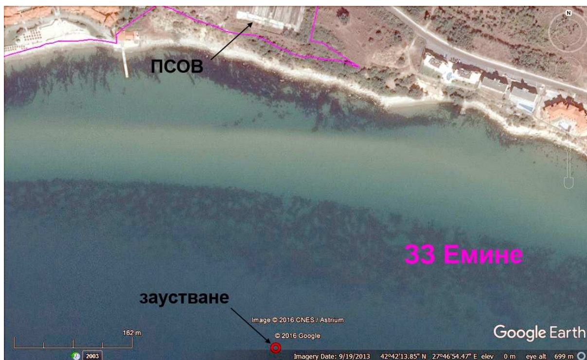
Фигура 5.4.11-1 Характер на терена в и около обхвата на предложената структурна мярка. Розов контур - граница на 33.